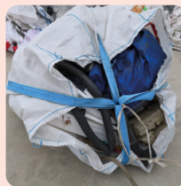
BIG-BAGS MÉLANGÉS AVEC AUTRES PRODUITS