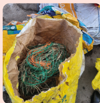
SACS OU CARTONS EN VRAC OU MÉLANGES AVEC D'AUTRES PRODUITS