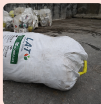
DÉCHETS CONDITIONNÉS BIG-BAGS