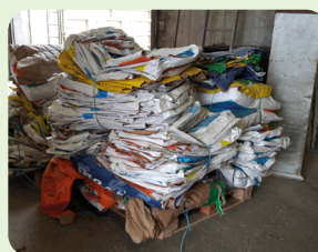
SACS PAPIER ET CARTONS